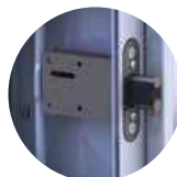
חמישה מנגנוני תגבור כפולים