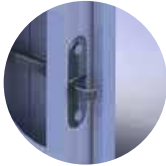
עוקץ ביטחון גליטאטור בצד צירים