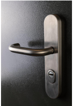
BKS RONDO ידית מנוף נירוסטה כולל מגן צילינדר