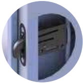
חמישה מנגנוני תגבור גליטאטור בצד מנעול