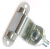
שלושה צירים סמויים