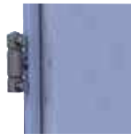
שלושה צירי פייפ