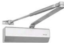
מחזיר שמן תואם את גודל הדלת