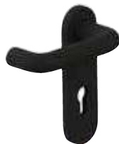
ידית שחורה אש אופציה לנירוסטה