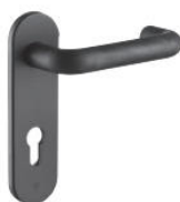
ידית אש שחורה אופציה לנירוסטה