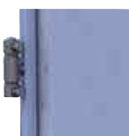
שלושה צירי פייב